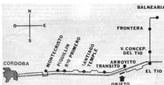
Figura 1: Mapa del trayecto Balnearia-Córdoba con las poblaciones intermedias. (Ilustró B.O.G.)

Instantes después observaron en el costado izquierdo del camino –a unos 50 metros de la ruta, y sobre un terreno completamente llano– una hilera de luces rectangulares que atribuyeron a un convoy ferroviario detenido (la vía férrea corre paralela al pavimento, según se advertirá en la figura 1). Las luces –de suave coloración anaranjada– parecían corresponder a una estructura de unos 50 metros de largo, cuyos contornos no pudieron determinar ya que se fundían en la oscuridad.