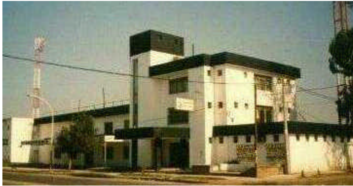
Edificio del club de fútbol "Chaco for Ever" con los colores típicos de San La Muerte: negro y blanco