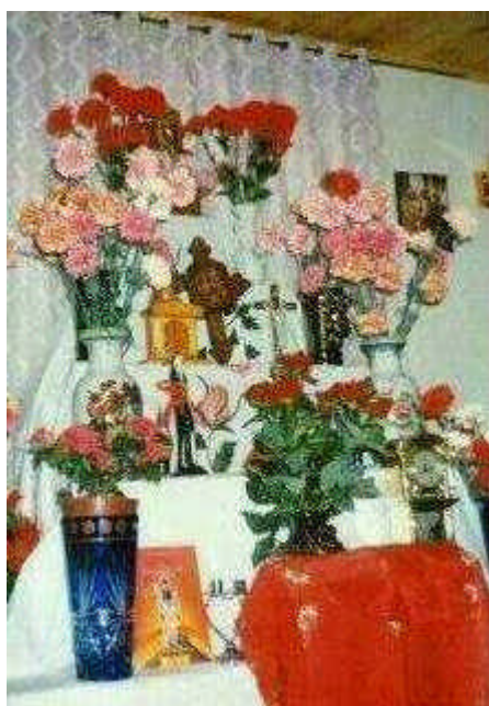
Otra vista del altar. Arriba, al centro, la pequeña y centenaria

San La Muerte. Señor de la Buena Muerte. Señor de la Paciencia. San La Paciencia. Señor La Muerte. San Justo Nuestro Señor de la Muerte. Nuestro Señor de Dios y la Muerte. San Esqueleto. Señor Que Lo Puede Todo. San Severo de la Muerte. O San, simplemente. Distintas denominaciones para una misma entidad arquetípica que –huelga decirlo– es sólo “santo” en la mentalidad simple pero profunda del pueblo, pues no lo registra el santoral católico. Cubierto con una capa negra y guadaña, con guadaña y sin capa, o en la versión más sugestiva de un esqueleto acuclillado y con las manos sosteniendo la barbilla, este payé o amuleto debe estar hecho preferentemente de plomo –mejor aún si es de la bala que mató o hirió a algún ser humano–, de hueso humano, o, en su defecto, madera o yeso. No debe tener más de quince centímetros de altura y si los sobrepasa, el altar que lo guarde no debe estar expuesto a miradas indiscretas.